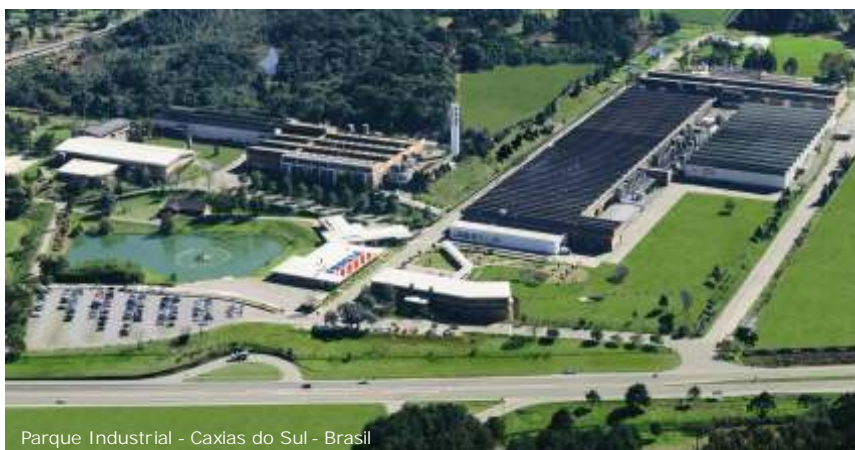
Parque Industrial - Caxias do Sul - Brasil

Massa Específica: ..... 2,16 g/cm 3 Dureza (NBR 5544): ..... 21 GC